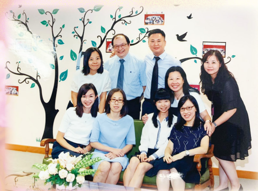
葉校長（後排右二）與一眾老師合照

我們深信在教育孩子的過程中，家長和學校是緊密合作的夥伴。為促進良好的家校溝通，推動彼此的緊密合作，家長教師會以多元的活動，鼓勵更多家長加入這個學習社群，並藉此建立家長間互相支持的網絡，推動家長以正面、積極的態度去教養孩子，令孩子們明白及實踐「慎思明辨」的校訓，做一個有素質的德蘭女兒。