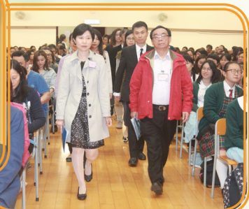
校監及署任校長帶領家長委員進場