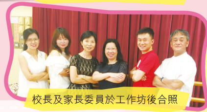
校長及家長委員於工作坊後合照