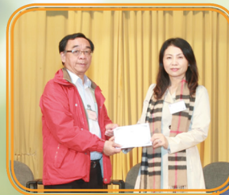
家長委員從校監接過委任狀