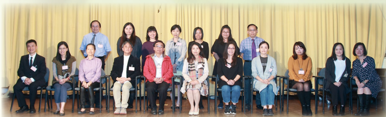
新一屆委員大合照